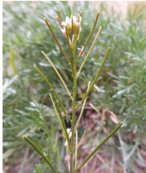
Abbildung 2: Öhrchen-Gänsekresse mit sparrig abstehenden Schoten (22. 3. 2014)