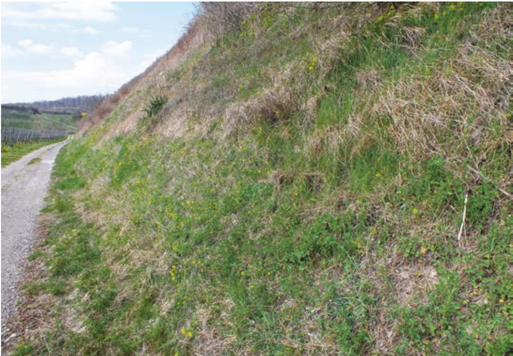
Abbildung 5: Mulchstreifen mit Ohrchen-Gänsekresse bei Ihringen (22.03.2014)