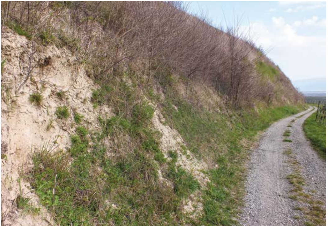
Abbildung 4: Lössböschung mit Vorkommen der Öhrchen-Gänsekresse am Lasenberg bei Bötzingen (22. 3. 2014)

( Arenaria seryplifolia ) mit 50 % und Weiße Fetthenne ( Sedum album ) mit 45 %.