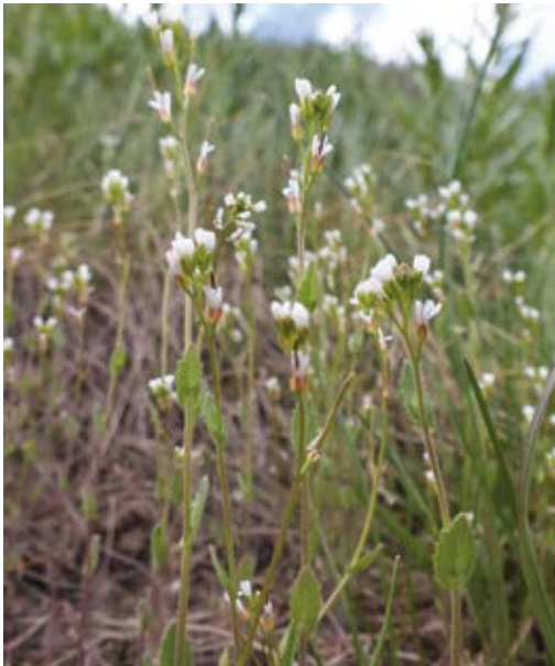
Abbildung 1: Öhrchen-Gänsekresse im blühenden Zustand mit stängelumfassenden und geöhrtten Stängelblättchen (13. 4. 2013)

dagegen sind die Schoten nach oben am Hauptstängel anliegend. Die Wuchshöhe variiert stark und hängt vom jeweiligen Standort ab. Sie kann an trockenen, nährstoffarmen Wuchsorten nur 3–5 cm betragen, während die Pflanzen an nährstoffreicheren und feuchteren Stellen gut 30 cm hoch werden können.