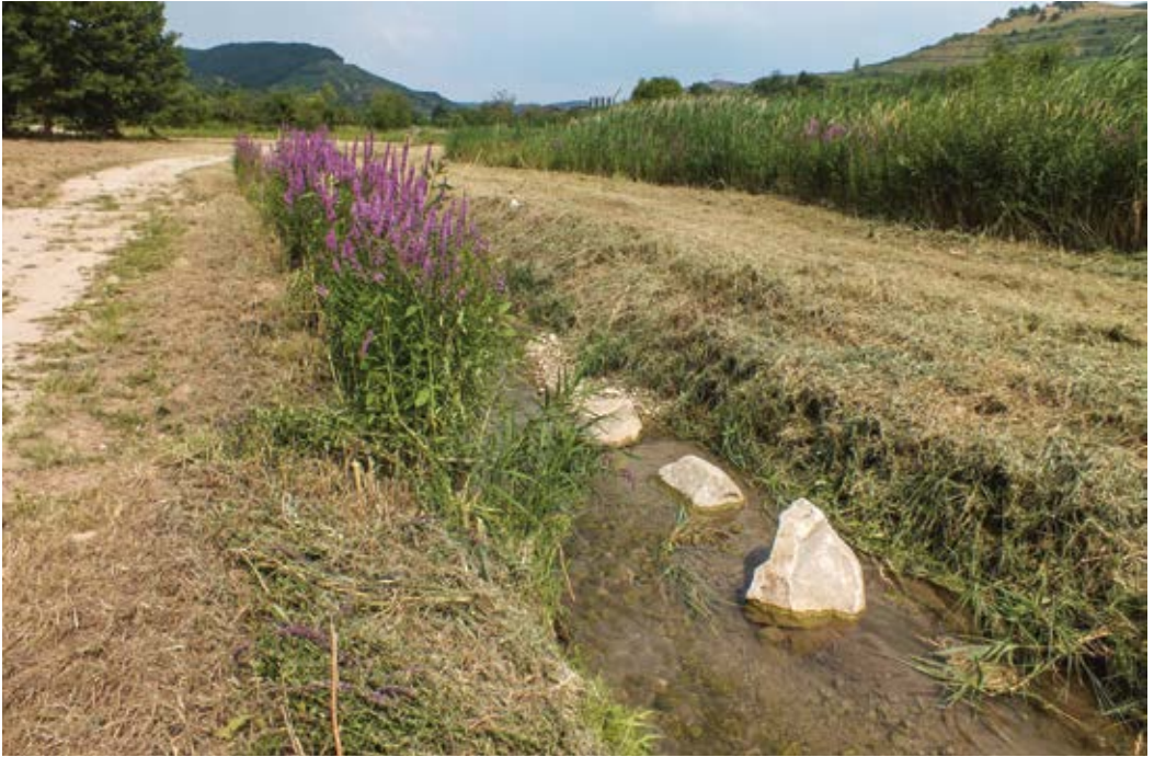
Abbildung 10: Blutweiderich wird bei Unterhaltungsmaßnahmen an Gewässern gezielt belassen, wie hier im Rückhaltebecken Ried bei Vogtsburg-Oberrotweil (Juli 2013)