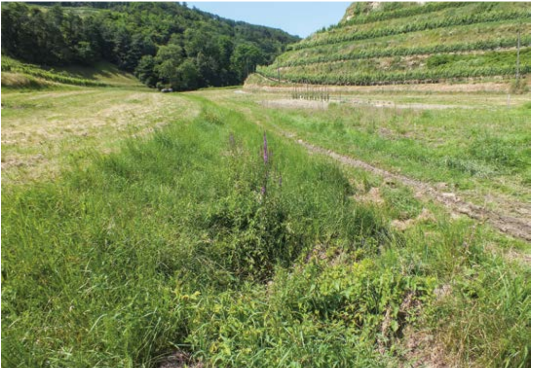
Abbildung 7: Stark verändertes Nahrungshabitat am Talausgang des Hessentals nach Rodung der Obstanlage und Mulchen der Fläche (Juli 2013)