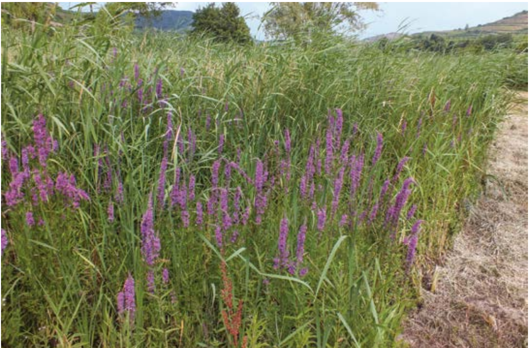
Abbildung 11: Schilfried mit Blutweiderich bleibt bei Unterhaltungsmaßnahmen in Rückhaltebecken erhalten (Juli 2013)