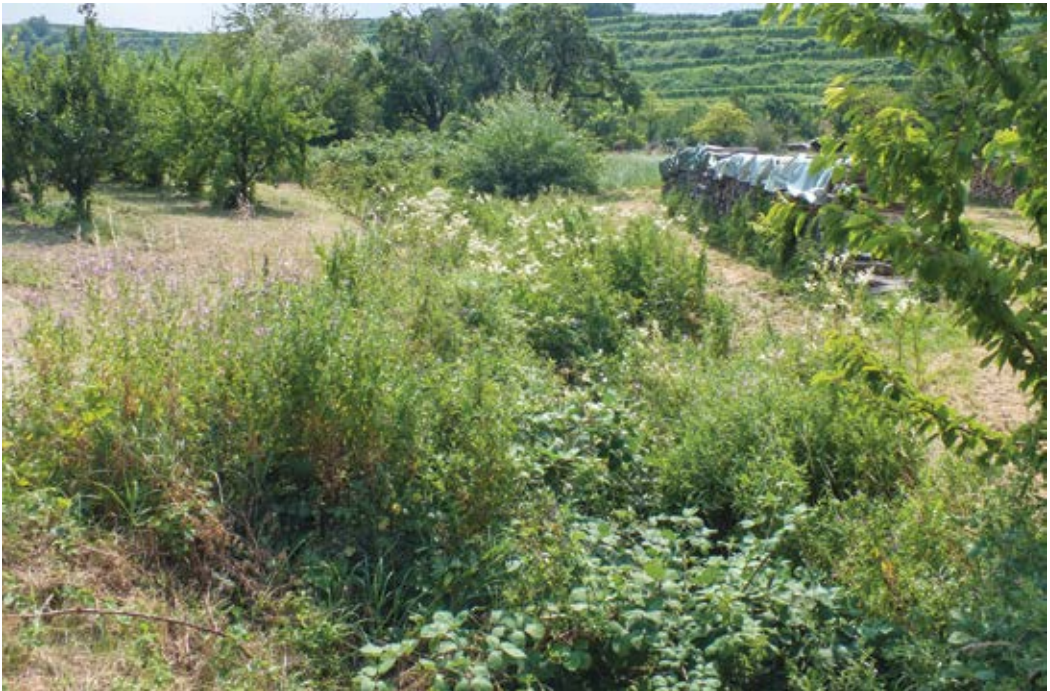
Abbildung 8: Mit Armenischer Brombeere überwachsener Graben – das Nahrungshabitat ist am Ellenbuch bei Vogtsburg-Oberrotweil bedroht (Juli 2013)