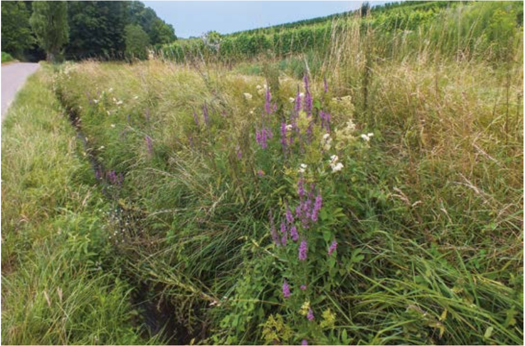
Abbildung 3: Bachbegleitende Mädesüß-Staudenflur mit Blutweiderich ( Lythrum salicaria ) am Talausgang des Mühlentals in Ihringen (Juli 2013)