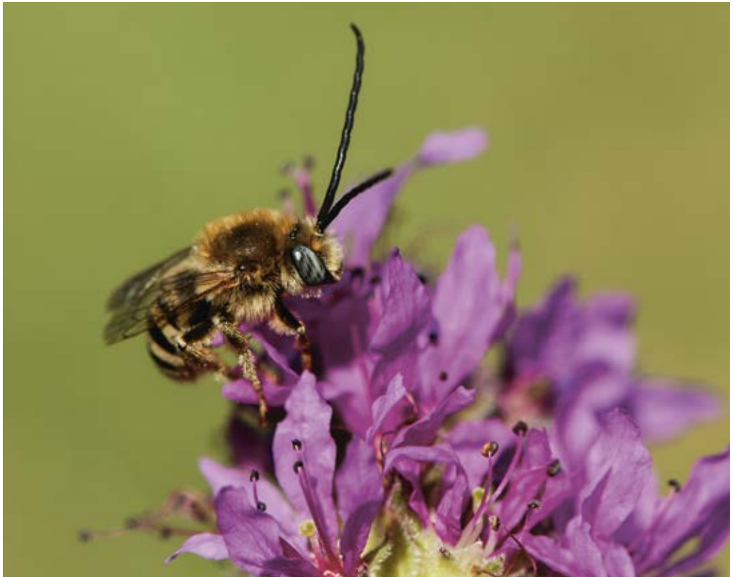
Abbildung 1: Männchen der Blutweiderich-Langhornbiene ( Tetraloniella salicariae ) im Juli 2013

Die Ergebnisse wurden dokumentiert und analysiert. Sie belegen nicht nur ökologische Wechselbeziehungen zwischen trockenwarmen und feuchten Lebensräumen, sondern geben darüber hinaus Hinweise, über welche Distanzen Nahrungshabitate angeflogen werden, welche Gefährdungsfaktoren zu einem Rückgang der Art führen können und welche Maßnahmen ergriffen werden müssen, um die Blutweiderich-Langhornbiene sowie andere Wildbienen-Arten zu fördern.