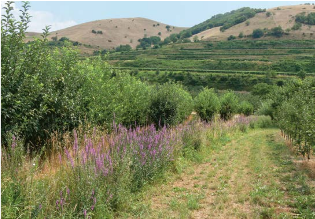
Abbildung 6: Nahrungshabitat der Blutweiderich-Langhornbiene am Talausgang des Hessesentals angrenzend an Trockenhänge in Vogtsburg-Oberbergen am 29. 7. 2006