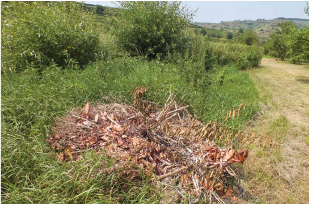
Abbildung 9: Bachufer als Ablagerungsort. Somit wird das Nahrungshabitat, wie hier im Juli 2013 am Eschbach bei Bickensohl, entwertet.