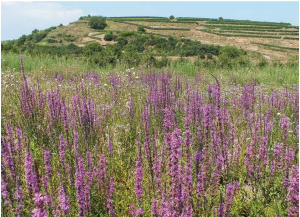
Abbildung 5: Ackerbrache mit dichtem Bestand von Blutweiderich im Wasenweiler Ried (Juli 2013)