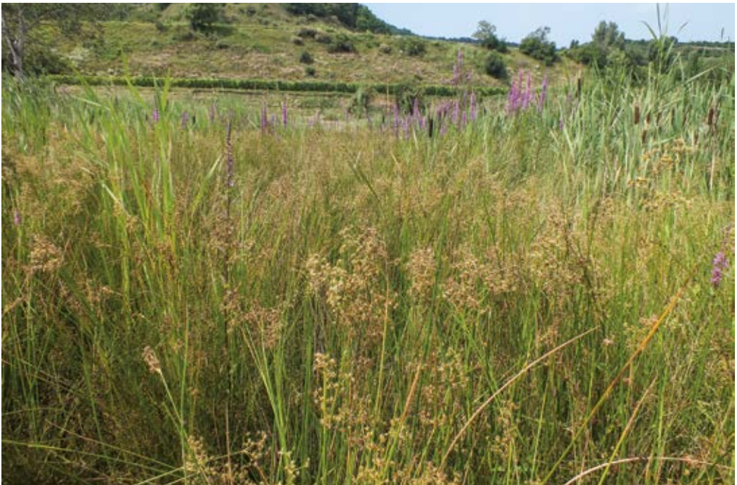
Abbildung 4: Ried der Stumpfblütigen Binse ( Juncetum subnodulosi -Gesellschaft) mit Blutweiderich im Rückhaltebecken Ried bei Vogtsburg-Oberrotweil (Juli 2013)